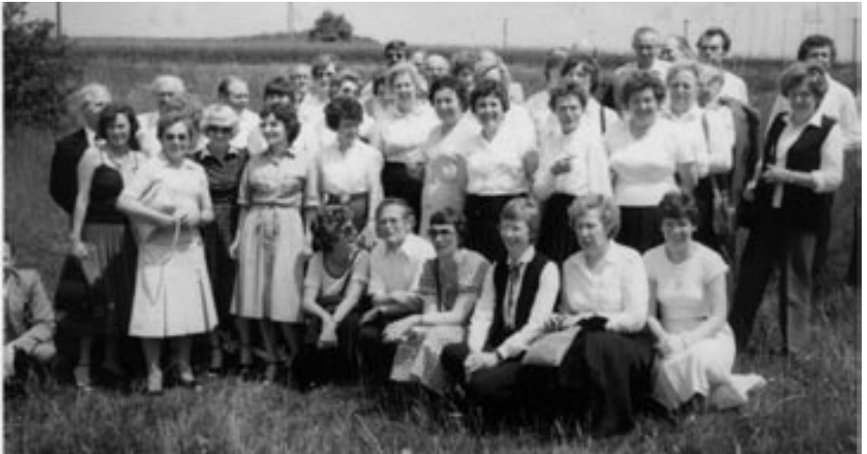
Der Chor in Hirstein/Saarland 1980