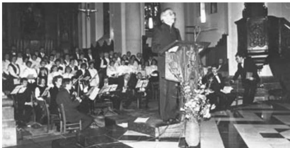
Aufführung des „Messias“ von G. F. Händel in St. Sebastian am 31.1.1988