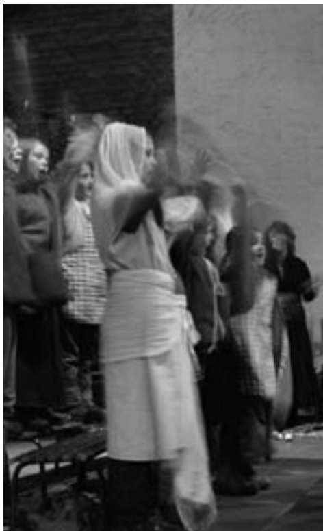
Singen bewegt und begeistert - Kinder und Erwachsene

es viermal singe, kann es durch Tonhöhe und Rhythmus so variiert werden, dass sich eine echte Steigerung ergibt. Der Überschwang (der nicht nur auf diese Weise in Erscheinung tritt) aber ist eine