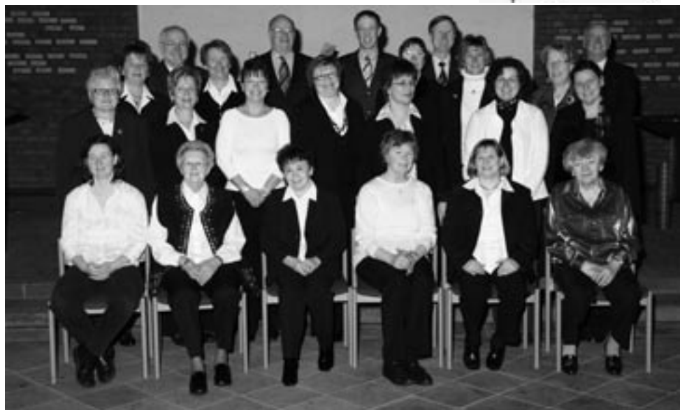
Der Chor der evangelischen Gemeinde Würselen im Jahr 2007