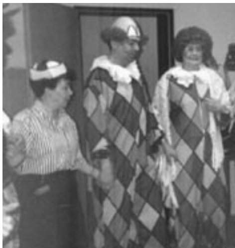
Lustig im Karneval

wo ein Konzert gegeben wurde. Dass auch ein Kirchenchor im karnevalsbesessenen Grenzland wohl zu feiern versteht, zeigt die untenstehende Aufnahme.