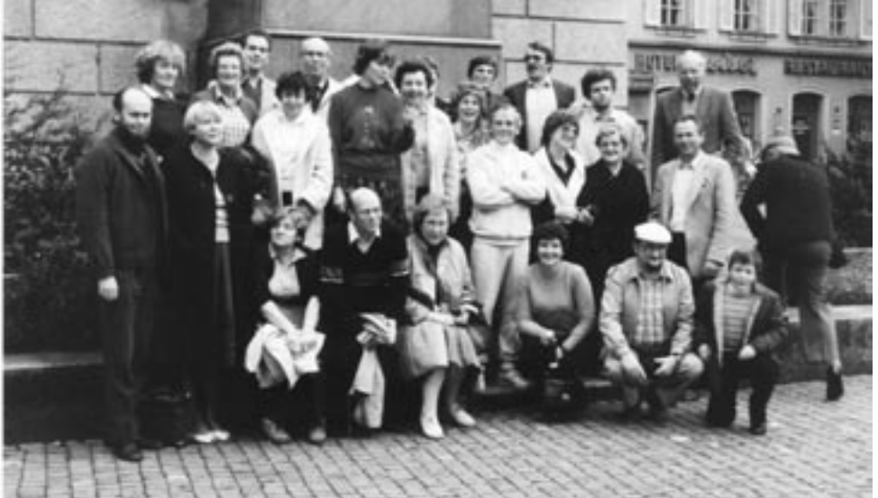
Reisegruppe des Chores in Ebikon/Schweiz 1982

für einen stattlichen Klangkörper, der sich unter der geschickten und handwerklich gekonnten Führung von Pfarrer Lösch allmählich entwickelte und bis zum 1.10.1980 auf 47 aktive Mitglieder angewachsen war.